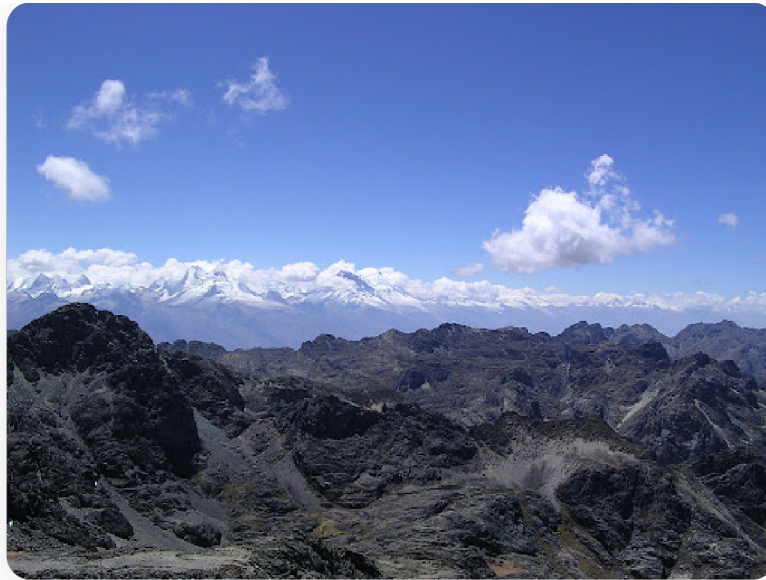
Cordillère Noire en premier plan et cordillère Blanche en arrière-plan

Ce qu'on appelle la « cordillère Blanche » est en fait une portion enneigée de la cordillère des Andes qui s'étend sur 180 km du nord au sud du Pérou. Son point culminant est le Huascarán (plus de 6 750 m), qui est également le point le plus haut de tout le pays. La cordillère Blanche compte de nombreux pics enneigés qui culminent à plus de 6 000 mètres d'altitude et plus de 500 lacs et lagunes , ce qui en fait un véritable paradis pour les amateurs de trekking ou d'activités alpines.